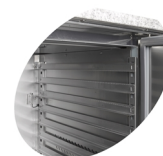
Guides pour plateaux à pizza