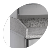
Dessus de table en granite